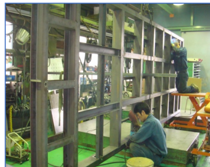
チャンネルベース

★営業担当者制で「個別要望や複雑形状など顧客の要望を聞き出すところから対応し、短時間で納品できる」ところも強みの1つです。