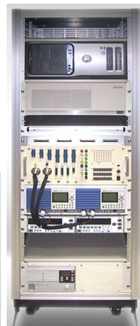
【弊社開発特注製品の一例】